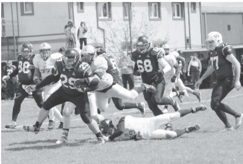
Egy elcsúszott passzból touchdownt értek el a vendégek a második féldőben, és ez annyira megzavarta a marosvásárhelyieket, hogy hiába volt hátra még mintegy másfél negyed, többé már nem tudták megközelíteni az ellenfél célterületét.

Az eset annyira megzavarta a marosvásárhelyieket, hogy hiába volt hátra még mintegy másfél negyed,